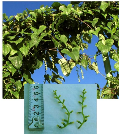
いちょういも群（雌花） つくねいも群