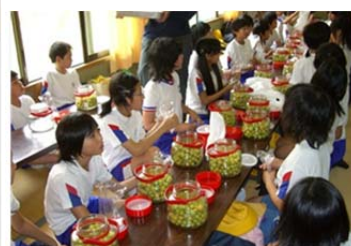
地元小学生のうめ漬け体験教室