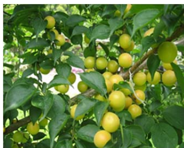
収穫直前の「七折小梅」