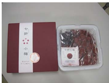
「七折小梅」の梅干し